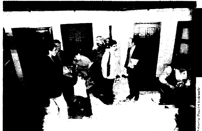
Na stoiskach producenci stolarki drzwiowej prezentowali najmłodniejsze modele drzwi wewnętrznych i zewnętrznych.