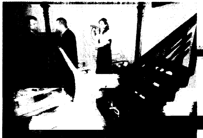
Można było wybierać wśród szerokiej oferty schodów wykonanych z różnorodnych materiałów.