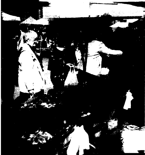
Zwiedzający wystawę będą mogli zaopatrzyć się na targach w nasiona, cebulki i sadzonki roślin do ogrodu.