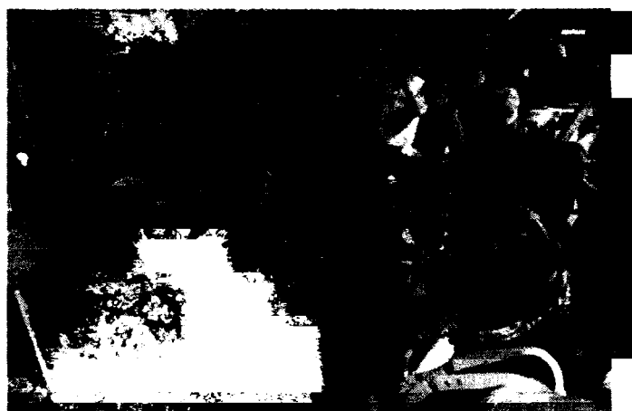
Sadzonki roślin ozdobnych do przydomowych ogrodów co roku cieszą się ogromnym zainteresowaniem klientów.