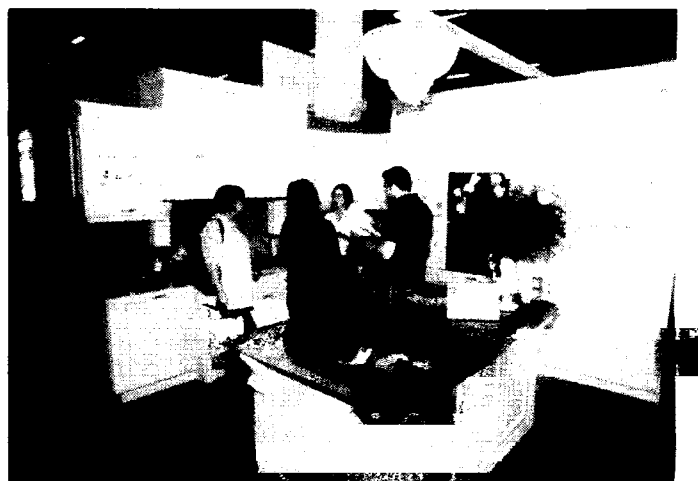
Piękne kuchnie prezentowane były na stoiskach firm z całej Polski.