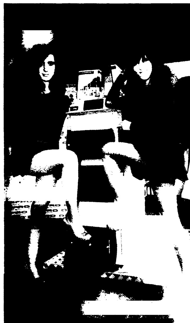
Stoisko firmy Defro z Rudy Strawczyńskiej produkującej nowoczesne piece na paliwa nie bez powodu przyciągało uwagę zwiedzających.